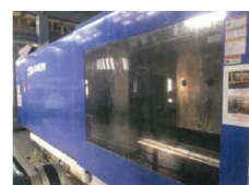
熊本工場 J910E II W 射出成形機

本社工場 〒470-2102 愛知県知多郡東浦町大字緒川字北鶴根66-5 TEL:(0562)84-7601 熊本工場 〒869-1102 熊本県菊池郡菊陽町原水字上大谷3802-32 TEL:(096)233-9555 宮崎工場 〒889-4222 宮崎県えびの市大字小田1350 TEL:(0984)35-2931