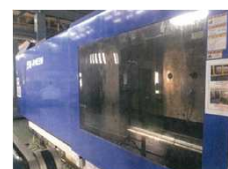
熊本工場 J910E II W 射出成形機

本社工場 〒470-2102 愛知県知多郡東浦町大字緒川字北鶴根66-5 TEL:(0562)84-7601 熊本工場 〒869-1102 熊本県菊池郡菊陽町原水字上大谷3802-32 TEL:(096)233-9555 宮崎工場 〒889-4222 宮崎県えびの市大字小田1350 TEL:(0984)35-2931