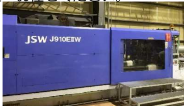
910 t 成形機