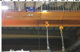
15 t 天井クレーン